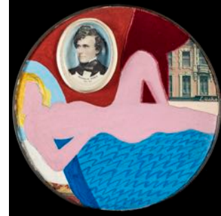
Little Great American Nude #1, 1962, Paint, plastic portrait, printed reproductions, fabric with pencil on metal plate, 17,8 cm

Les premières œuvres de Tom Wesselmann datent de la fin des années 50 et du début des années 60, et étaient principalement des collages réalisés à partir de papiers peints et d'annonces publicitaires, parfois associés à des nus peints dans des intérieurs américains. Ces œuvres sont extrêmement rares et se trouvent principalement dans des collections de musées à travers le monde. Deux petites œuvres de ce type seront exposées à la Brafa.