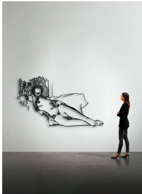
Monica Nude with Matisse, 1987 Enamel paint on laser-cut steel 128 x 218 cm

Le record de vente pour une œuvre de Tom Wesselmann s'élève à 10,7 millions de dollars et date de 2008. Il va de soi que la gamme de prix des œuvres exposées à la foire Brafa est considérablement inférieur allant de 50 000 à 750 000 euros, mais il est plausible que Wesselmann puisse être la redécouverte dans les prochaines années.