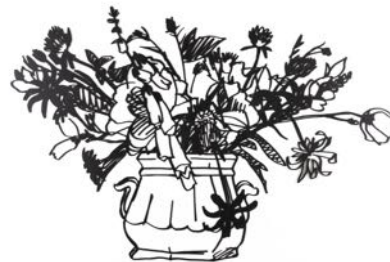
Wildflower Bouquet, 1988 Enamel paint on laser-cut steel 147,3 x 147,3 cm