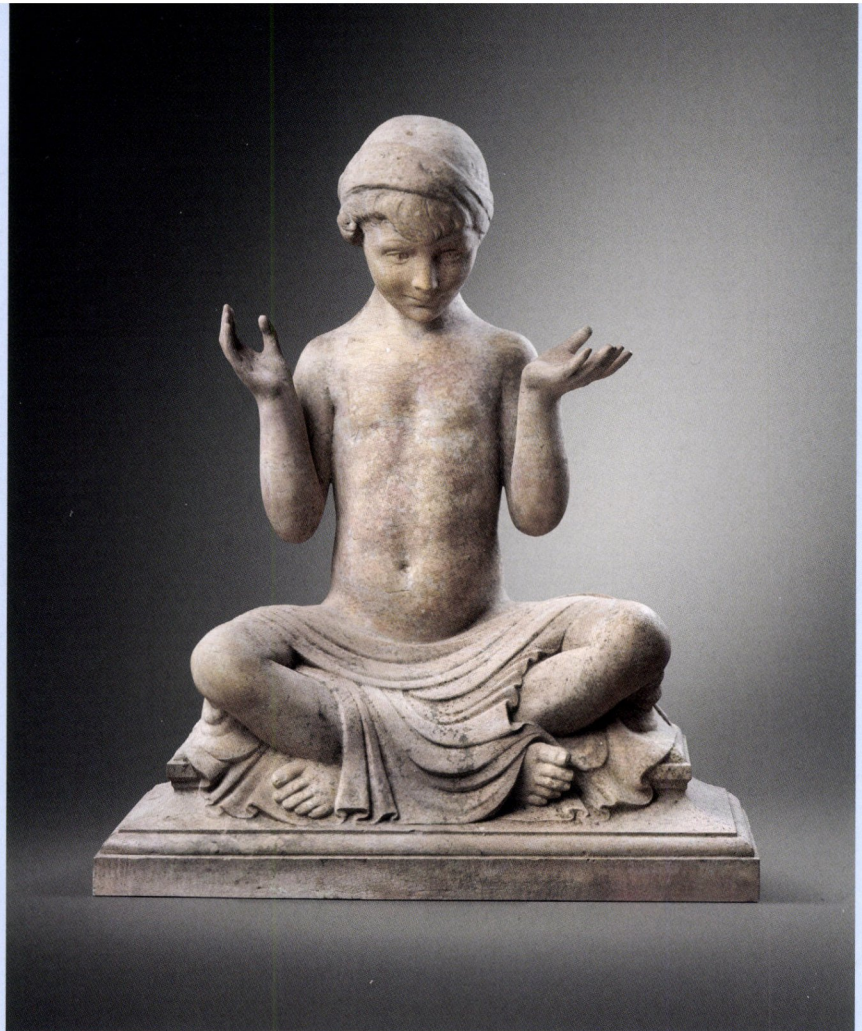
Janet Scudder, Bird Bath , Verenigde Staten, ca. 1921, sculptuur in marmer, 88 x 73 x 36 cm. © Victor Werner.