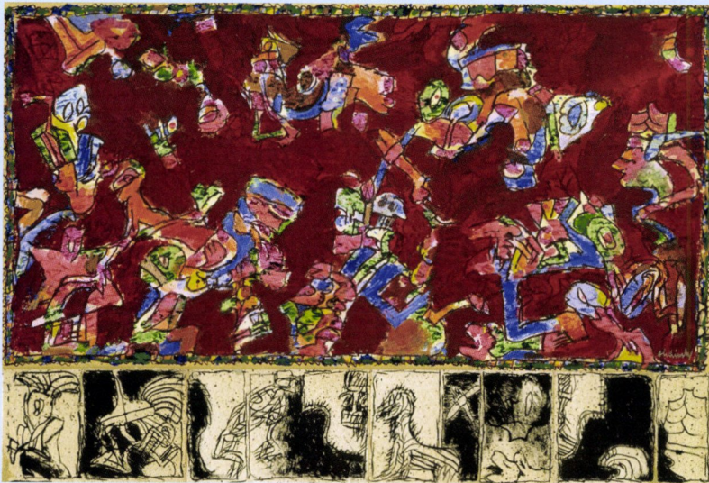
Pierre Alechinsky, Fête Lapone , 1981, acrylverf en inkt op papier, 199 x 297,50 cm.