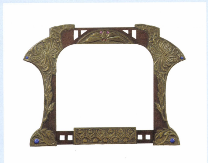
Kader in art nouveau-stijl, metaal, hout, steen, 32,3 x 37,5 cm. © Galerie Montanari.