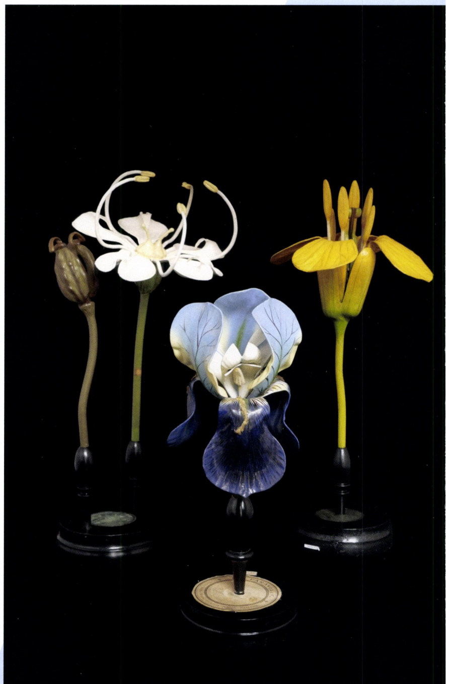
Botanische modellen van de firma R. Brendel, begin 20e eeuw, Duitsland, papiermaché en hout.