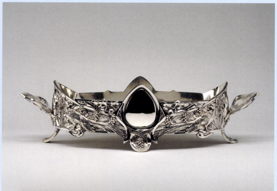
Philippe Wolfers voor Wolfers Frères, Jardinière dit 'Faisans et raisins' , ca. 1901, zilver 800 ‰ (met verzilverd koperen bak), 58 x 29 x 16 cm, gestempeld voor Wolfers Frères. Deze jardinière moet samen met twee vergelijkbare ontwerpen in de collectie van de KMSKG gezien worden in de context van een ongedocumenteerde serie. Prijs: € 18.000.

Thomas Deprez Fine Arts Brussel www.thomasdeprezfinearts.com