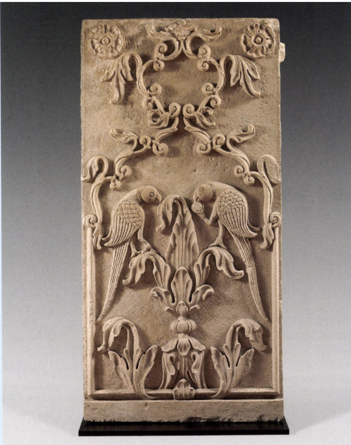
Paneel uit het Moghol-rijk, Centraal-India, 18e eeuw, zandsteen, hoogte: 101 cm, Britse privécollectie.