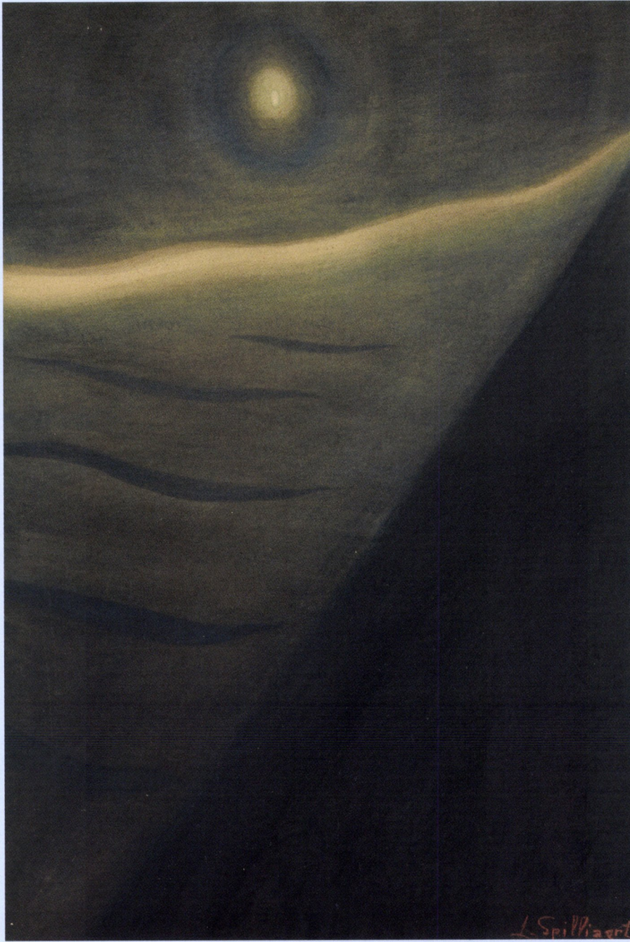
Leon Spilliaert, De Lichtboei , 1910, Chinese inkt en potlood op papier, 72 x 49 cm, gesigneerd rechtsonder.