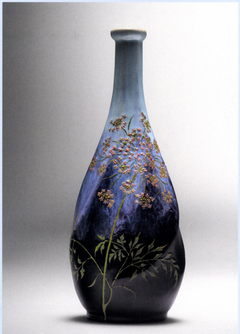
Emile Gallé, keramieken vaas, ca. 1889, Japans druijglazuur, decoratie in goud en email, hoogte: 23 cm, Franse privécollectie.