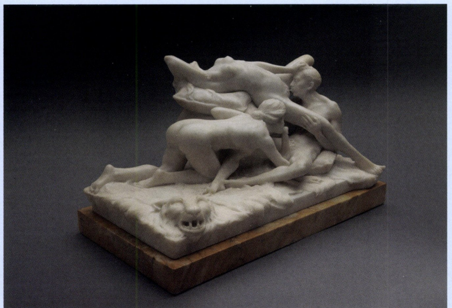
Per Hasselberg, Erotica Marble , ca. 1890, wit marmer op een Giallo di Siena-marmeren basis, hoogte: 22,3 cm.