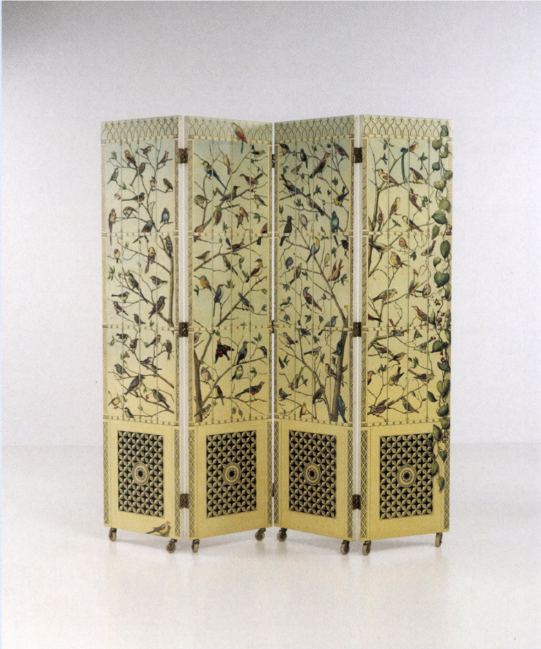
Piero Fornasetti, vouwbaar scherm Uccelli , ca. 1953, handgeschilderd hout, koper, 206.5 x 200 x 3 cm. © Gokelaere & Robinson.