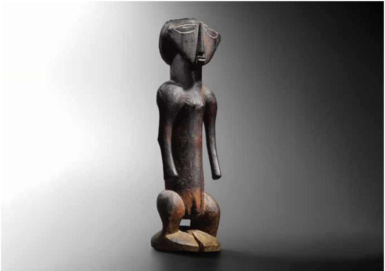
Statue Buyu - Republic Democratic of the Congo XIX - XX century - Wood - h. 59 cm

La BRAFA, evento importante sia in Belgio che a livello internazionale, è la fiera che preferisco. La mia galleria partecipa da diversi anni, quest'anno sarà il ventesimo. La BRAFA rappresenta un momento di incontro imprescindibile, poiché il Belgio è una delle culle dell'arte africana e i collezionisti sono numerosi. A ogni edizione porto in fiera una mostra tematica, che richiede lunghi anni di preparazione prima di arrivare a maturità ed essere pronta per l'esposizione. Per quanto riguarda la selezione delle opere classiche, non si può parlare propriamente di un filo conduttore stabilito a priori. La selezione avviene a mano a mano che scopro queste opere, che le incontro.