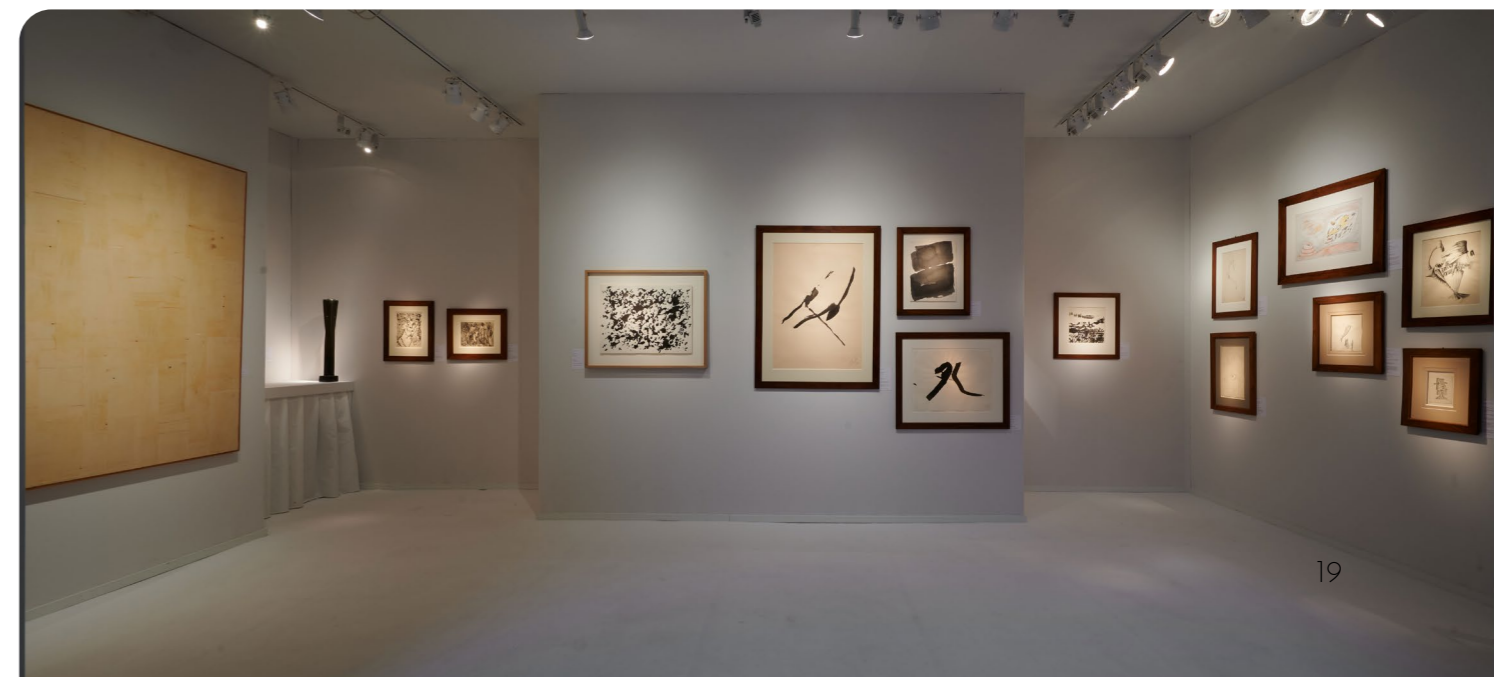
Galerie Schifferli, BRAFA 2020

Galerie Schifferli proporrà un dialogo tra dipinti e disegni moderni e opere d'arte tribale. A giugno saranno presenti a Bruxelles anche la Galleria Cortesi (arte europea del dopoguerra) e De Jonckheere (maestri antichi e moderni), così come la galleria Simon Studer Art Associés (arte impressionista, moderna e contemporanea).