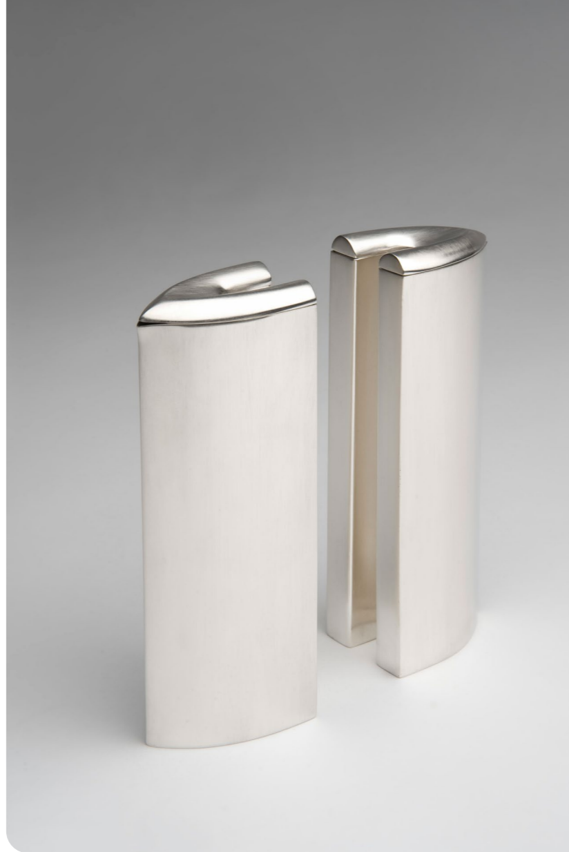
Galerie Latham, Barbara Amstutz, Vinegar &amp; Oil