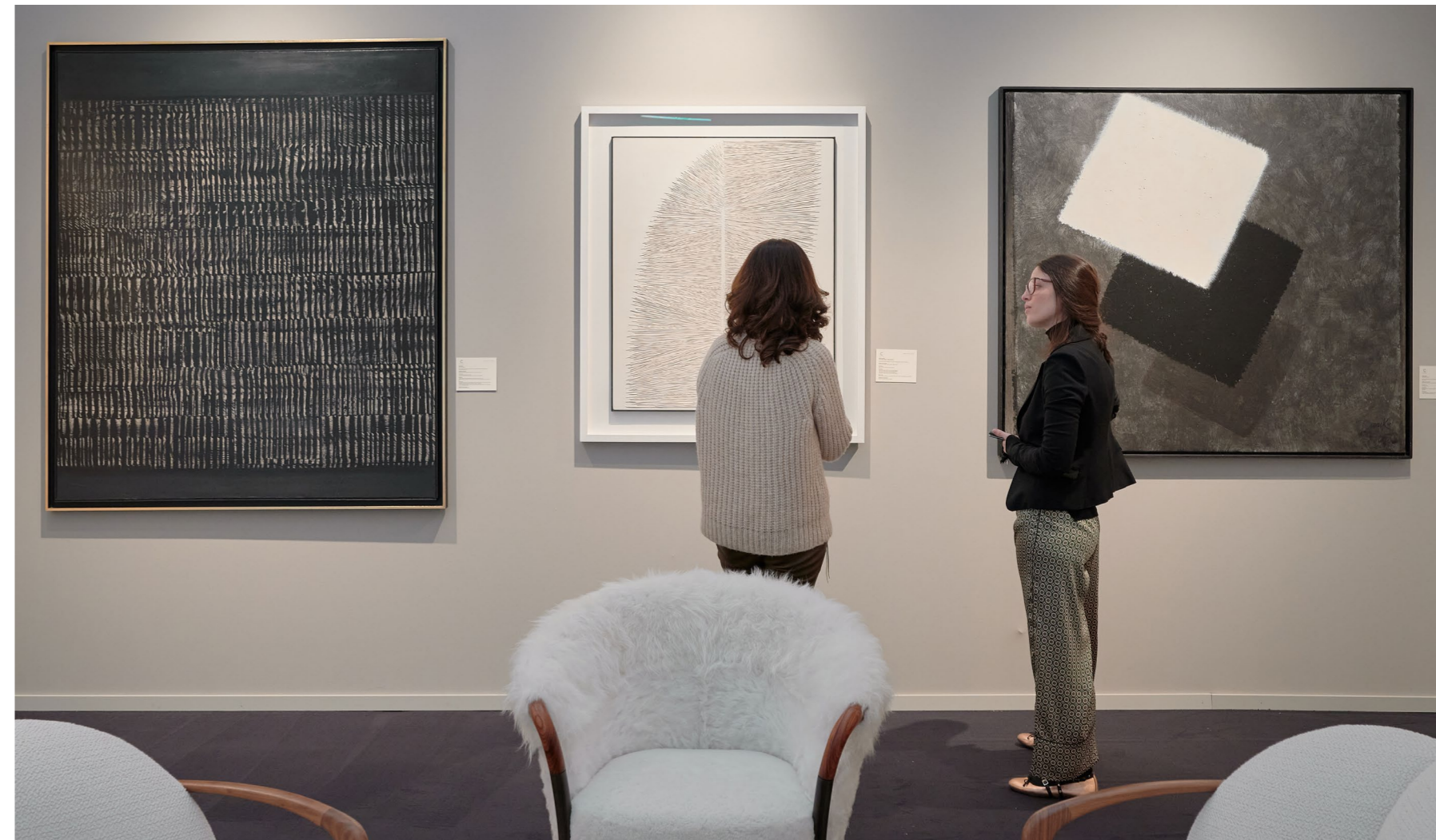
Cortesi Gallery, BRAFA 2020

BRAFA is a fair on a human scale. In the space of a few hours, visitors are taken on an eclectic journey through periods and styles. Open to all market trends and a pioneer in certain fields, the fair truly stands out today for its diversity and its “cross-collecting” specificity.