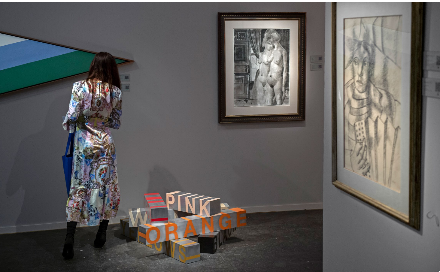
Simon Studer Art Associés, BRAFA 2020