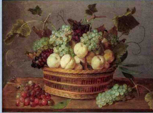
← Jacob Van Hulsdonck, Still Life with peaches and grapes, huile sur panneau, 50 x 64 cm COLLECTION GRASSET.